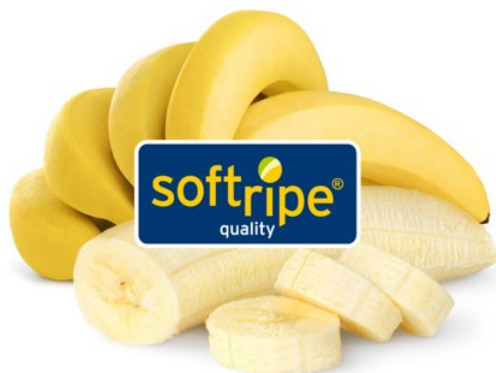
Soft-Ripe-gereifte Bananen.

Die neue Technologie „Soft-Ripe“ zeichnet sich durch ein verbessertes und vollautomatisches Reifeverfahren aus. Im Unterschied zur Standard-Reifung wird hier der physiologische Zustand der Bananen erfasst und die Reifung daraufhin optimal abgestimmt (Bild).